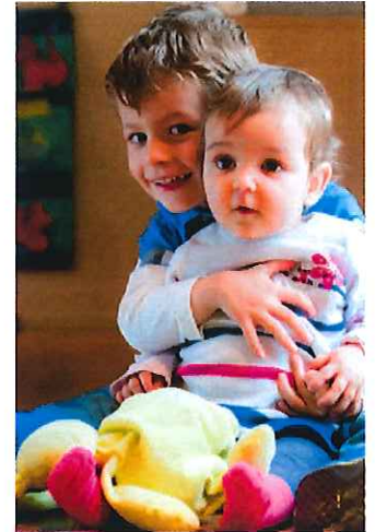
... et où ils apprennent beaucoup sur les règles de vie en société et réalisent de nombreuses activités, tout en s'amusant !

La piscine à boules ! Il aime aussi beaucoup les excursions au marché de Morges qui, non seulement leur apprennent les fruits et légumes de saison, mais aussi les règles de sécurité routière. Il adore les bricolages et l'atelier cuisine. L'équipe éducative est excellente, très professionnelle, à notre écoute et à l'écoute des besoins des enfants. Chaque soir, nous avons un compte-rendu détaillé de comment s'est passée la journée et on travaille ensemble sur les points à régler tant à la maison qu'à la crèche. La communication est excellente !