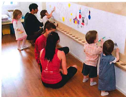
Les infrastructures de la crèche permettent aux enfants de laisser libre cours à leur imagination.